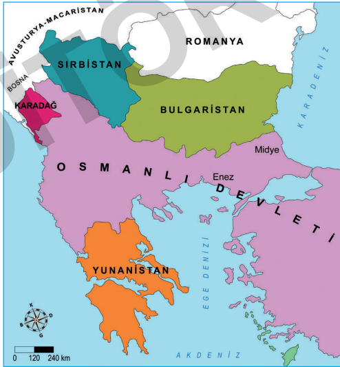
I. Balkan Savaşı Öncesinde Balkanlar