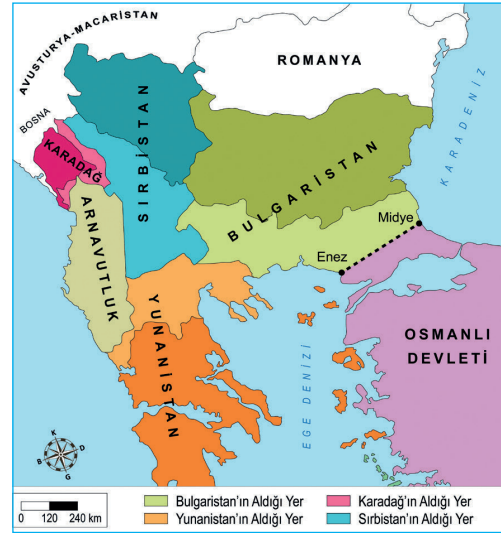
I. Balkan Savaşı Sonrasında Balkanlar

Verilen haritalara göre I. Balkan Savaşı ile ilgili aşağıdakilerden hangisi söylenemez ?