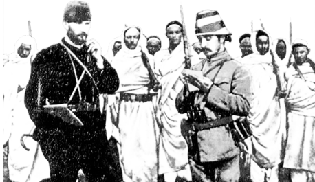
Trablusgarp Savaşı'nda Mustafa Kemal