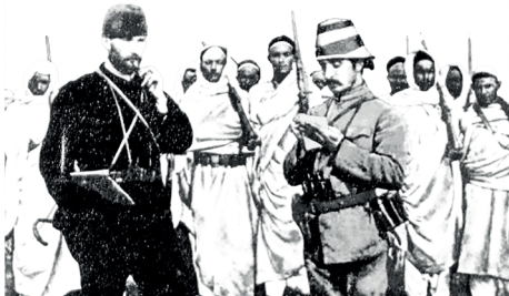
Trablusgarp Savaşı'nda Mustafa Kemal