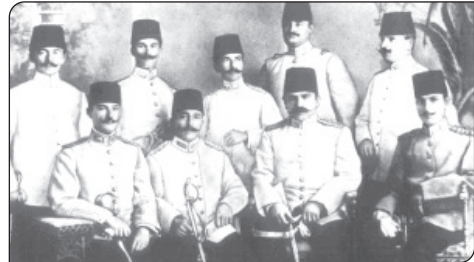
Manastır Askeri Lisesi